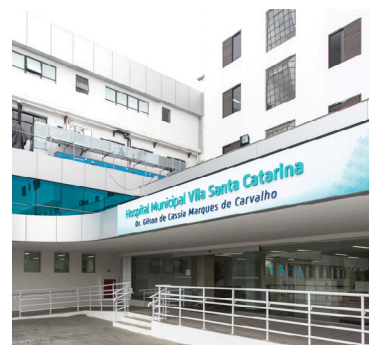
Hospital Municipal Vila Santa Catarina