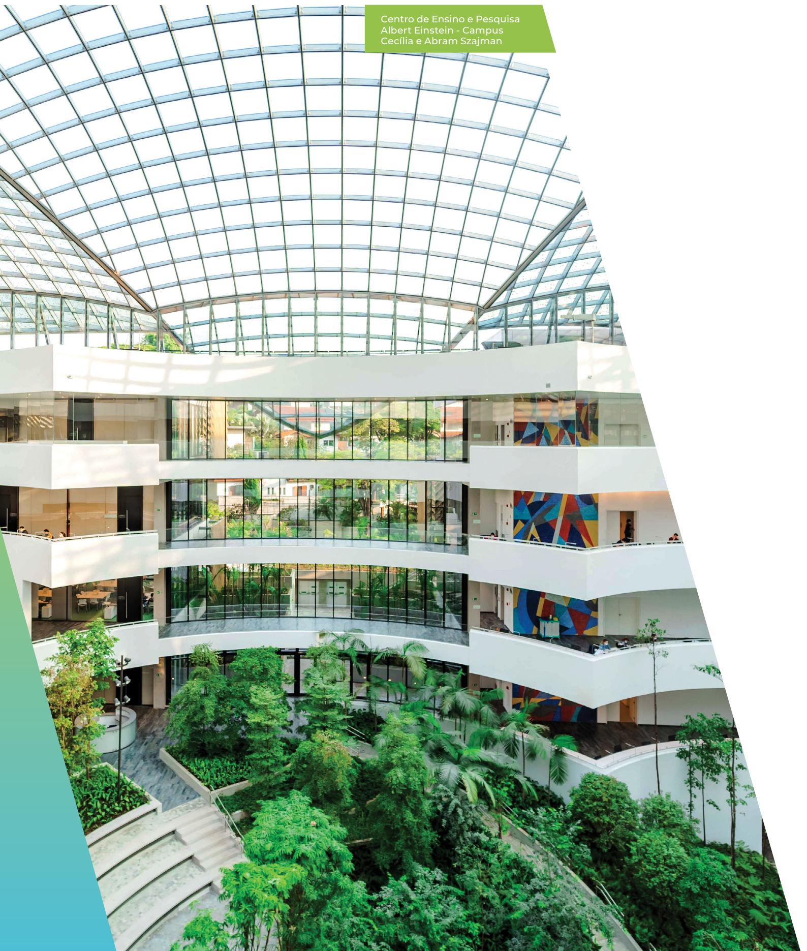
Centro de Ensino e Pesquisa Albert Einstein - Campus Cecília e Abram Szajman