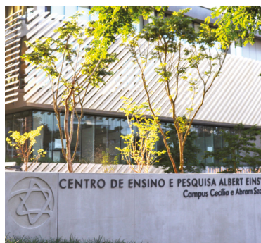
Centro de Ensino e Pesquisa Albert Einstein - Campus Cecília e Abram Szajman